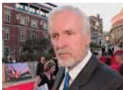
Cameron dreht drei weitere "Avatar"-Folgen