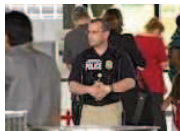
Reisewarnung für US-Amerikaner