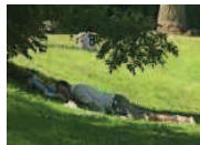
Hitze und Staus am Wochenende

Liegerad Dreirad Trike für Freizeit Sport und Reha 0,0% Finanzierung oder Leasing www.radweg.com